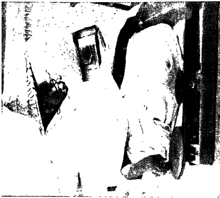
बापू : जूना काते मण्ड